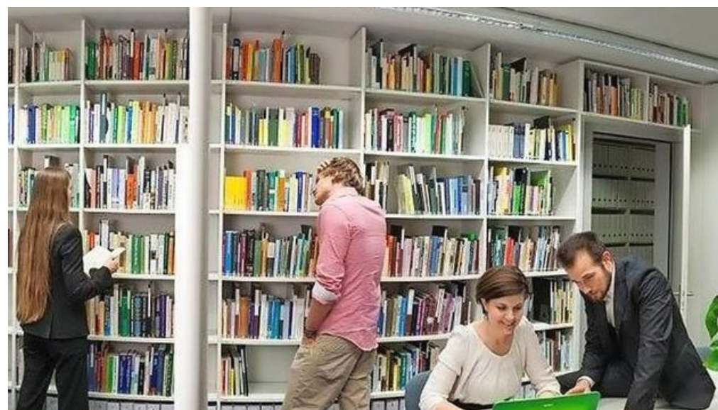
In der Bibliothek der Stiftung für das Tier im Recht herrscht reges Treiben.

Die Stiftung für das Tier im Recht (TIR) engagiert sich für die Verbesserung der Beziehung zwischen Mensch und Tier in Recht, Ethik und Gesellschaft.