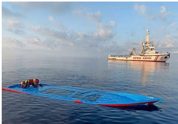
Ein Seenotretter durchsucht ein havariertes Flüchtlingsboot.

Die Mitarbeiter von Open Arms legten alles, was sie in dem Rucksack fanden, zum Trocknen aufs Deck ihres Schiffs, machten Fotos der Auslage und posteten die Bilder in den sozialen Medien. Das tut die Organisation immer, um Angehörige zu fin-