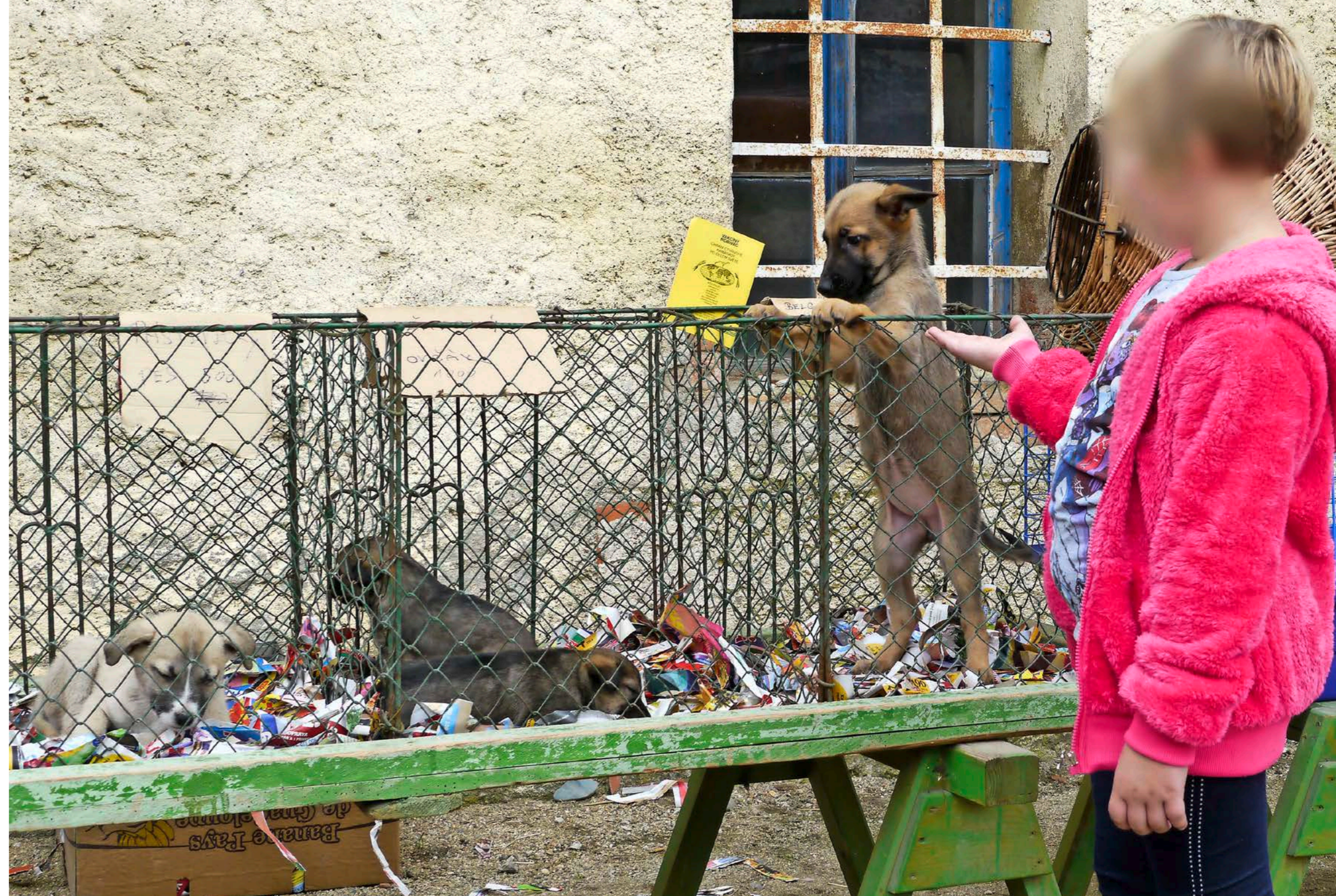
Welpen warten auf ein neues Zuhause mit mehr Sozialkontakten und weniger Papierschnipseln.

Zwei Drittel aller illegalen Welpentransporte gehen laut Deutschem Tierschutzbund nach oder über Deutschland. Weder haben