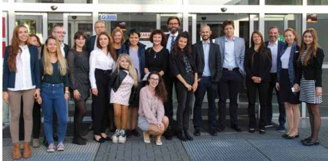
EGALS-Animal Law Conference Katowice (Polen), September 2017.