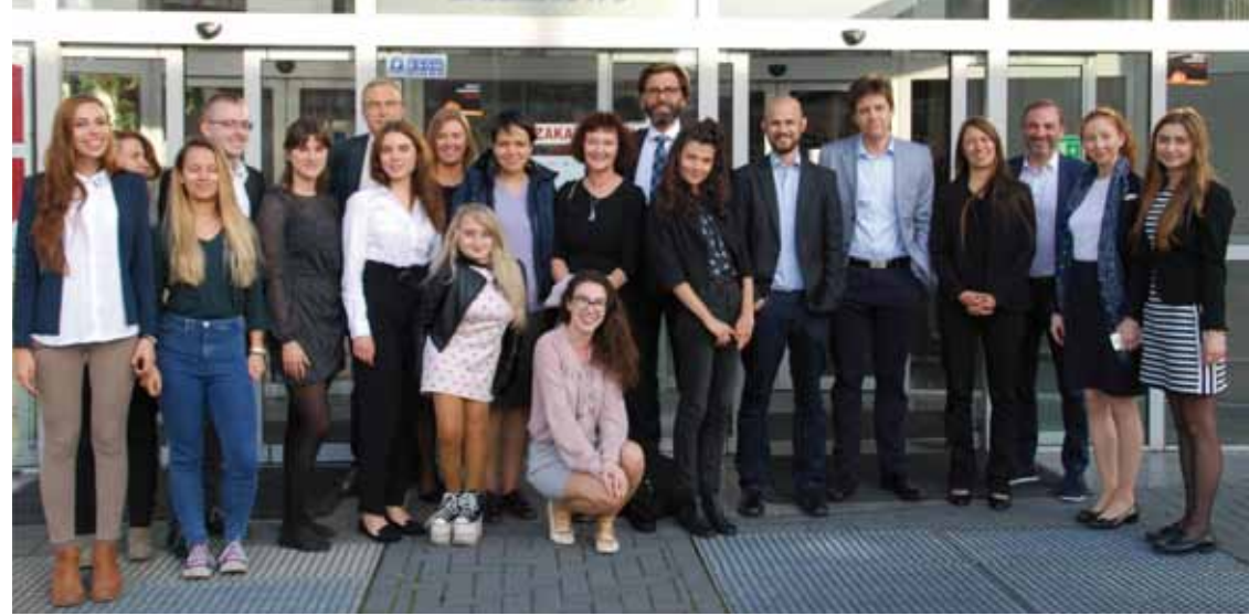
EGALS-Animal Law Conference Katowice (Polen), September 2017.