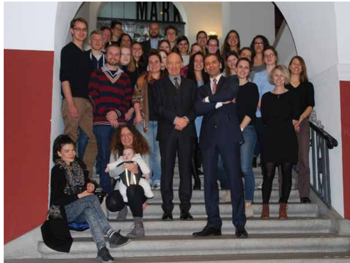
Prof. Dr. Daniel Jositsch mit TIR-Mitarbeitenden und den Teilnehmern des Tierschutzstrafrechtsseminars 2017.