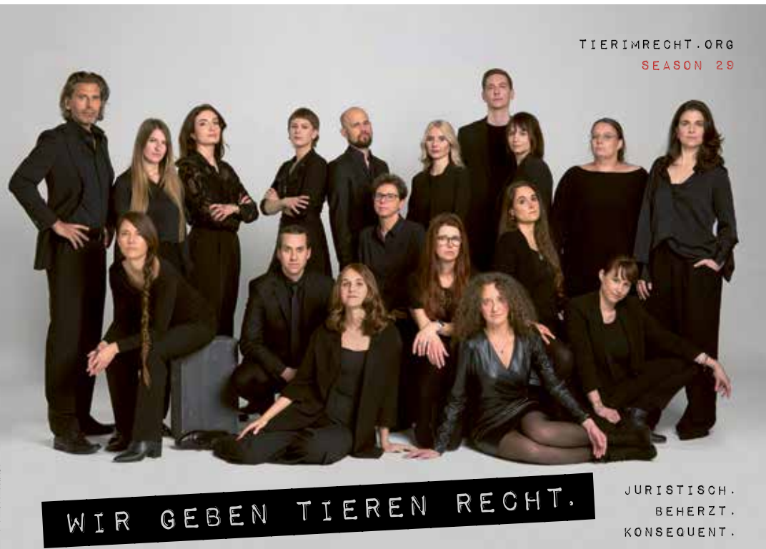
TIR-Team 2025 (Geschäftsjahr Nummer 29)

Das TIR-Team überzeugt nicht nur durch seine hohe Fachkompetenz und sein ausserordentliches Engagement, sondern auch durch eine bemerkenswerte Beständigkeit, die alles andere als selbstverständlich ist. Elf unserer achtzehn Mitarbeitenden sind seit mindestens zehn Jahren Teil unseres Teams und prägen unsere Organisation mit ihrer Erfahrung, ihrem Wissen und ihrer Verbundenheit entscheidend. Insgesamt vereint die TIR weit über 200 Dienstjahre – ein eindrücklicher Beleg für Kontinuität, Vertrauen und gelebte Zusammenarbeit.