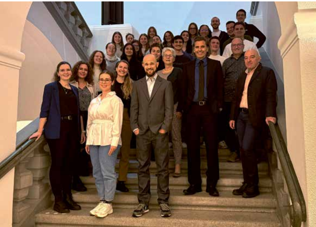
Gruppenbild Tierschutzstrafrechtsseminar 2025 (Universität Zürich)

Auch im Jahr 2025 haben wir verschiedene Master- und Doktorarbeiten zu tierrechtlichen Themen fachlich begleitet und unterstützt. Studierende unterschiedlichster Fachrichtungen profitierten dabei sowohl von der TIR-Bibliothek als auch vom Know-how unserer Mitarbeitenden, die ihnen mit Auskünften und Ratschlägen zur Seite standen. Darüber hinaus stehen wir regelmässig auch Maturandinnen und Maturanden sowie Berufs- und Sekundarschülerinnen und -schülern bei ihren Abschlussarbeiten als Interviewpartnerinnen zur Verfügung.