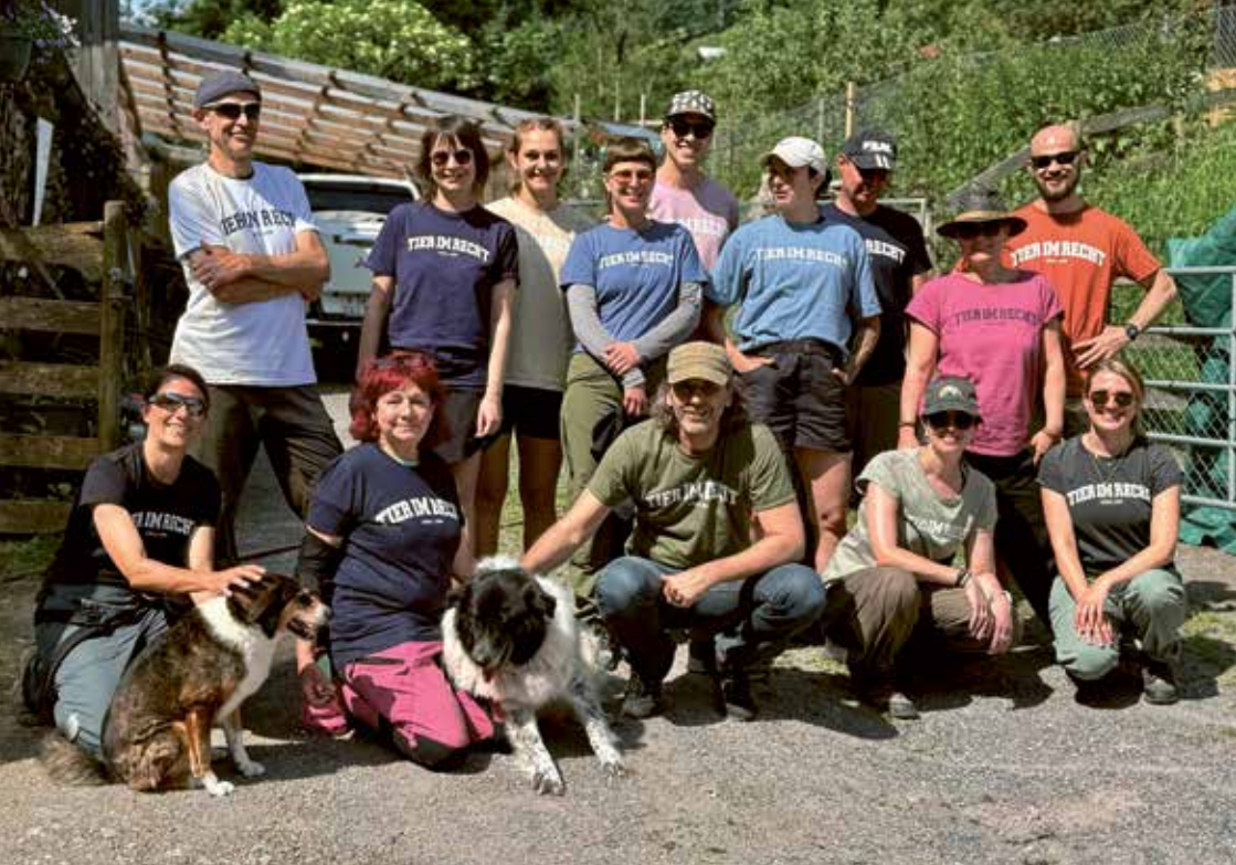
TIR-Team am Helfertag auf dem Gnadenhof Luna (Schwendi)