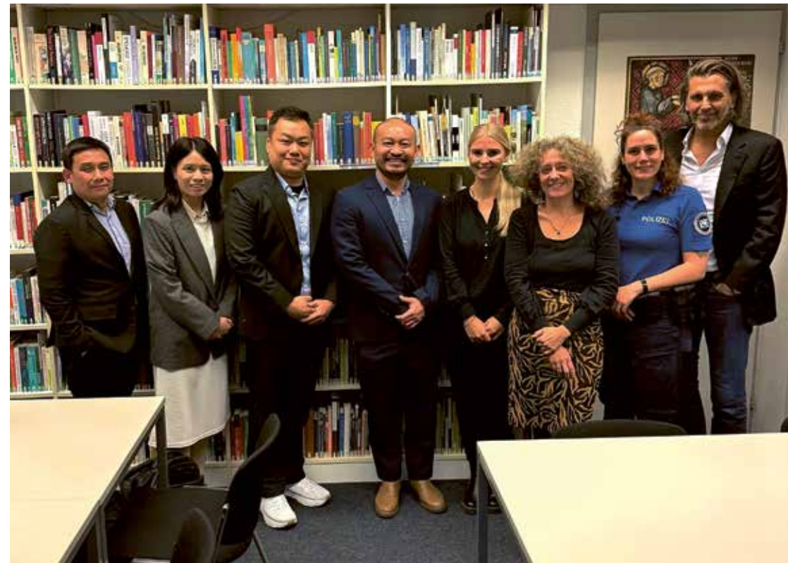
Offizieller Besuch einer Delegation des National Parks Board (Veterinärbehörde) aus Singapur an der TIR-Geschäftsstelle in Zürich

Im Anschluss an die Einblicke der Delegation in ihre eigene Praxis entwickelte sich ein vertiefter und erkenntnisreicher Austausch über Herausforderungen und Fortschritte im Tierschutzvollzug. Aus Sicht der TIR besonders bemerkenswert war etwa die Information, dass in Singapur seit Kurzem neben Hunden auch Katzen einer Registrierungspflicht unterliegen – eine Massnahme, die in der Schweiz trotz wiederholter politischer Vorstösse bislang nicht umgesetzt werden konnte. Die TIR hat sich sehr über den bereichernden internationalen Austausch gefreut. Sie hofft, die Bemühungen zur Zusammenarbeit und zur Förderung des Tierschutzrechts in der Schweiz und auch in Singapur weiter intensivieren zu können.