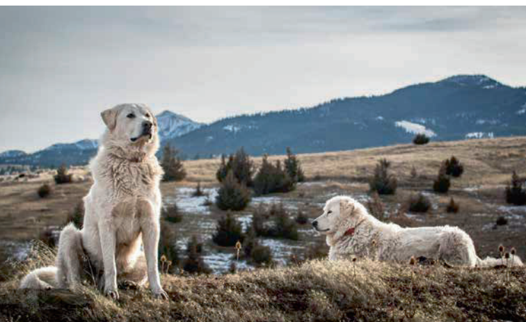
Herdenschutzhunde können Risse verhindern – doch Schutzmassnahmen sind weiterhin freiwillig.

Der TIR-Podcast zeigt auf, weshalb ein wirkungsvolles Tierrecht unverzichtbar ist, wo noch immer gravierende Lücken bestehen und wie diese gefüllt werden müssen. So wird mehr Bewusstsein geschaffen – und es entsteht Raum für positive Veränderungen zum Schutz der Tiere. Tier erst Recht! Alle zwei Wochen – überall, wo's Podcasts gibt.