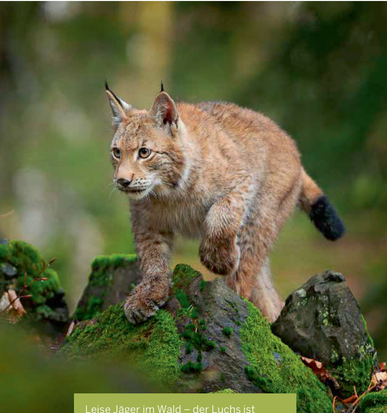
Leise Jäger im Wald – der Luchs ist geschützt, steht aber ebenfalls im Spannungsfeld von Schutz und Eingriff.