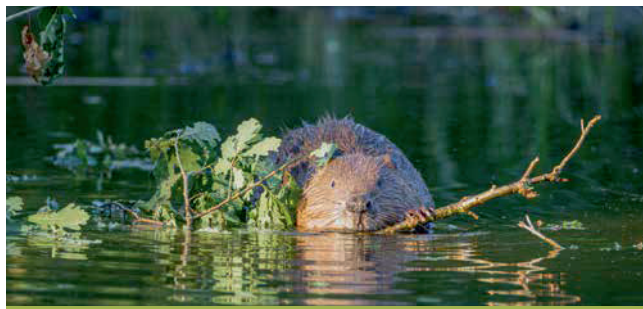
Stauen, graben, gestalten: Was für den Biber normal ist, wird in Konfliktlagen rasch zum «Schaden» erklärt.

Ebenso zu kritisieren ist, dass kein ausdrückliches Verbot von unbeaufsichtigten Geburten auf Alpen und Weiden, von tierschutzwidrigen Jagdmethoden – wie etwa der Baujagd – sowie von Alkoholkonsum im Rahmen der Jagdausübung aufgenommen wurde. Der Umstand, dass in der aktuell geltenden Jagdgesetzgebung Wölfe, Steinböcke und Biber getötet werden dürfen, noch bevor sie überhaupt einen nachweisbaren Schaden oder eine konkrete Gefährdung für sogenannte Nutztiere, die Umwelt oder den Menschen darstellen, widerspricht schliesslich dem im Schweizer Recht geltenden Verhältnismässigkeitsprinzip (Wahl des mildesten Mittels) und missachtet den in der Bundesverfassung wie auch in der Schweizer Tierschutzgesetzgebung verankerten Schutz der Tierwürde. Der Bundesrat hat es erneut verpasst, nachhaltige und verhältnismässige Lösungen für Konflikte zwischen Mensch und Wildtier zu präsentieren. Damit wird die Ansicht zementiert, dass es insbesondere für Grossraubtiere in der Schweiz keinen Platz gibt. Die Akzeptanz von Wildtieren und ihres arttypischen Verhaltens in der Gesellschaft wird durch deren Tötung in keiner Weise erhöht, vielmehr wird die Bevölkerung dazu verleitet, umgehend den Abschuss zu fordern, sobald sie aus der Sicht des Menschen negativ in Erscheinung treten.