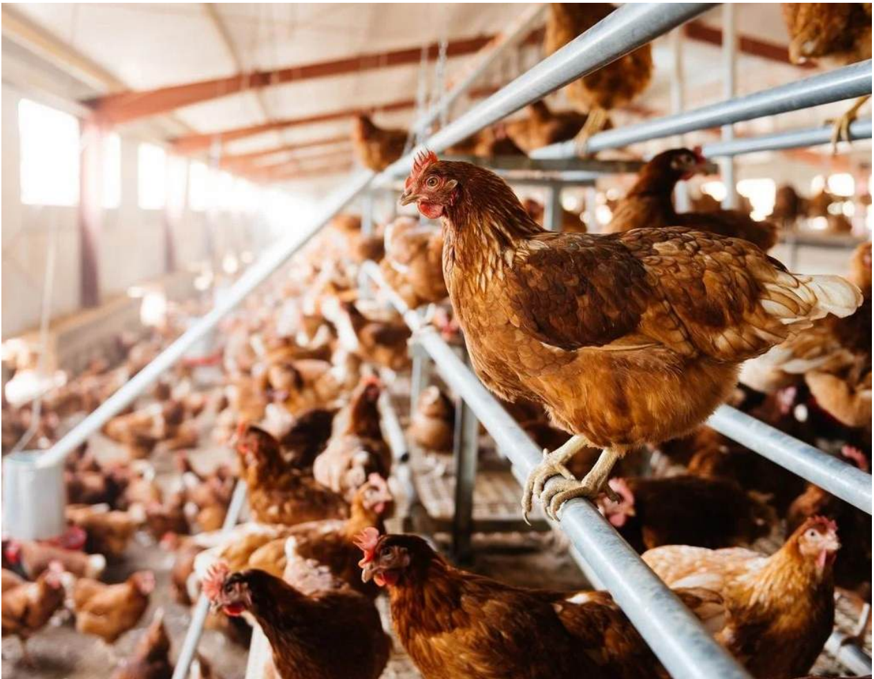
Die Auslauf-Initiative wurde von verschiedenen Tierschutzverbänden lanciert.