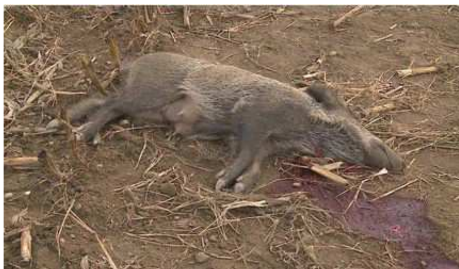
Das Martyrium des Muttertiers muss mehrere Stunden gedauert haben.