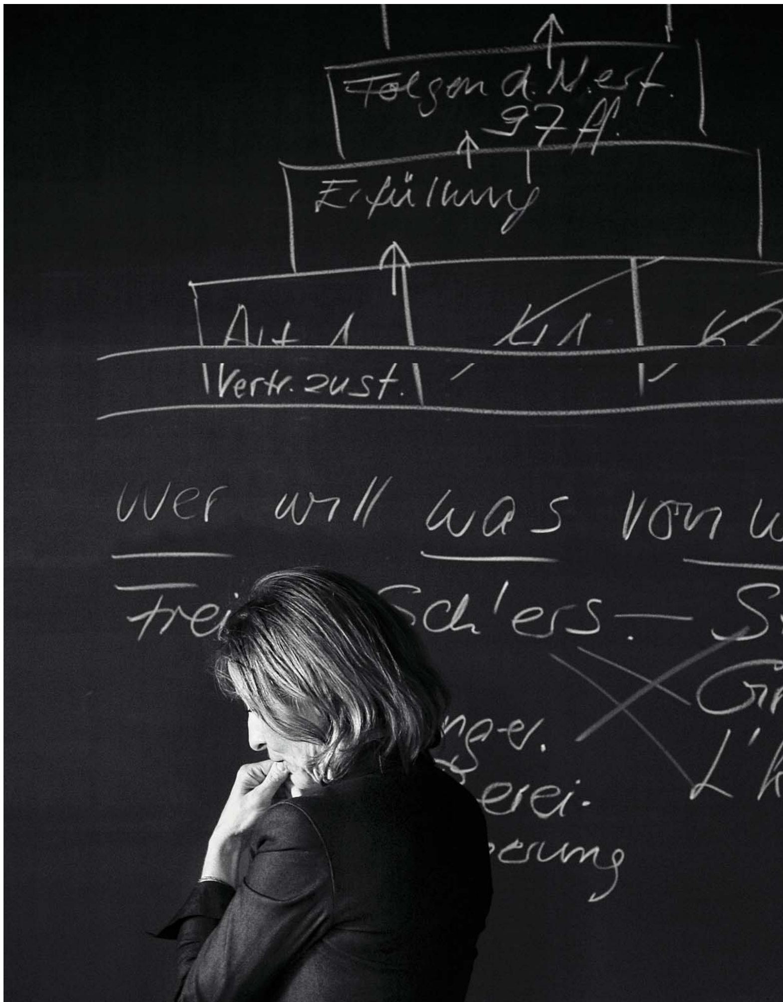
Im Gerichtssaal «zugelassen», also knapp geduldet: Doris Slongo, Konsumentenadvokatin.