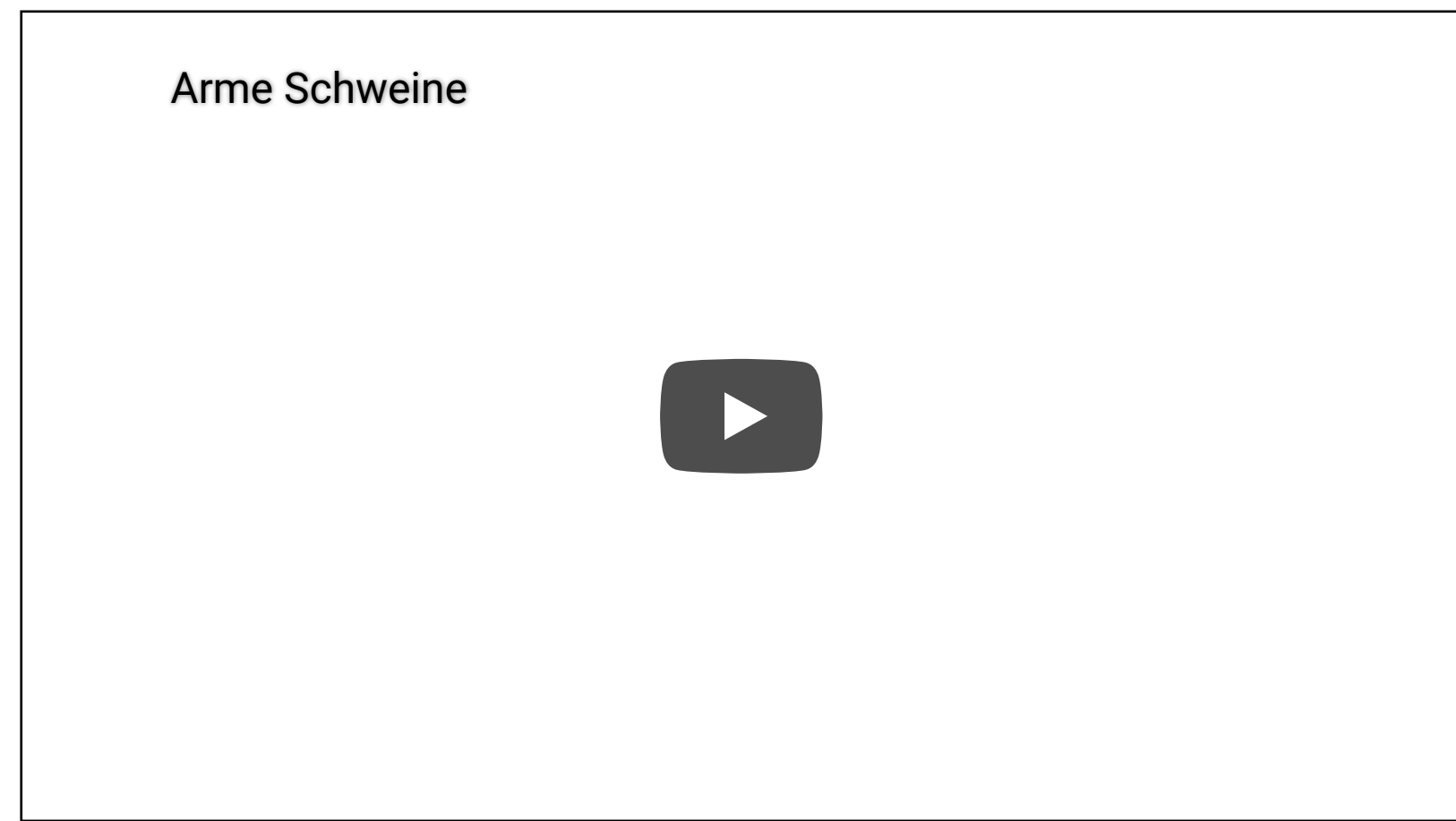
Tier im Fokus: Die Videoaufnahmen der Schweinemast-Betriebe

Basis für die Anzeigen bilden Filmaufnahmen, die zwischen April und Dezember 2019 entstanden, die Missstände in 13 Schweinezuchtbetrieben in den Kantonen Solothurn, St. Gallen, Bern, Luzern, Zürich, Schaffhausen und Aargau zeigen und anonym der Tierrechtsorganisation Tier im Fokus (TIF) zur Verfügung gestellt wurden. Zu sehen sind unter anderem tote Ferkel in einem Abfallkübel und ein Schwein, das auf nacktem Beton schläft und immer wieder von einem heftigen Keuchhusten geschüttelt wird.