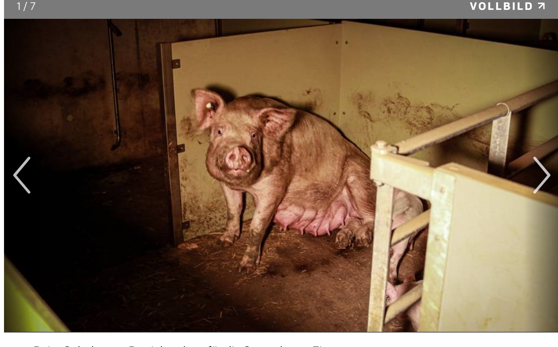
Beim Solothurner Betrieb gab es für die Sauen kaum Einstreu.