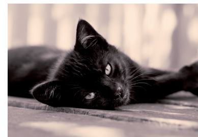
Kasimir (1990-2007) Familie Muster, Thun