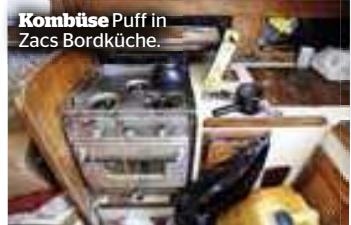
Kombüse Puff in Zacs Bordküche.