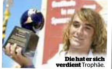
Die hat er sich verdient Trophäe.