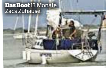
Das Boot 13 Monate Zacs Zuhause.