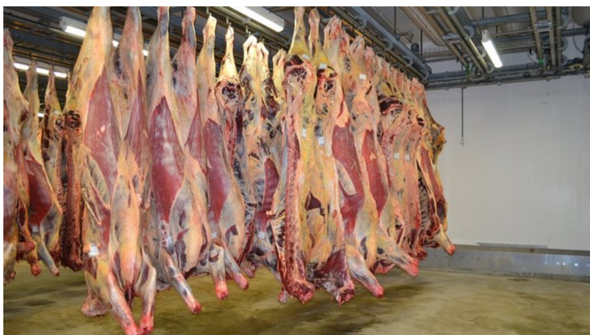
Verdeckte gedrehte Video-Aufnahmen hatten Verstösse gegen das Tierschutzrecht gezeigt. Der Bundesrat findet, es müsse das Personal besser geschult werden.

Die kleine Kammer hat am Mittwoch eine Motion von Ständerat Daniel Jositsch (SP/ZH) abgelehnt - mit 32 zu 5 Stimmen bei 6 Enthaltungen. Der Vorstoss ist damit vom Tisch.