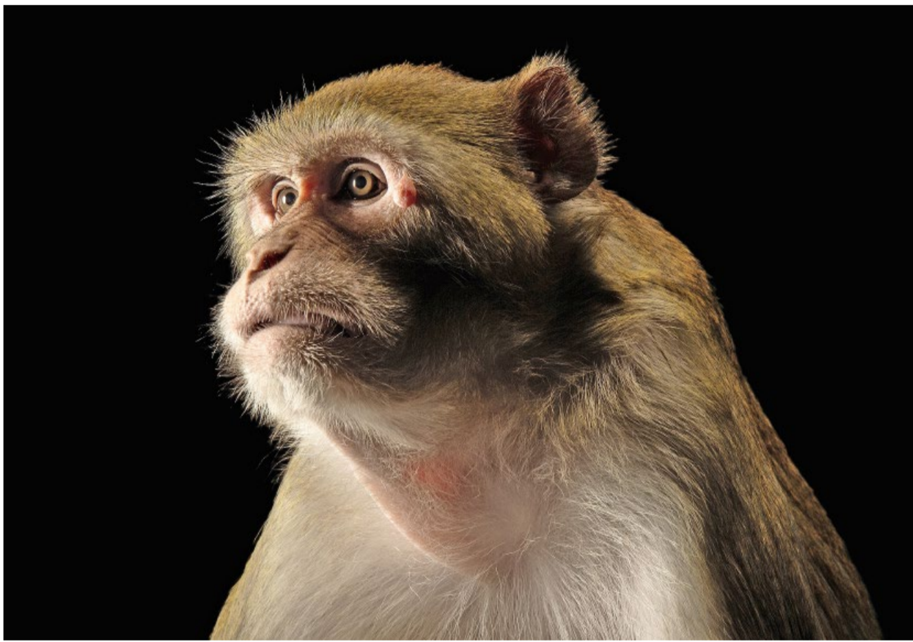
Rhesusaffe: An solchen Tieren sollen in Zürich Gehirnprozesse erforscht werden.