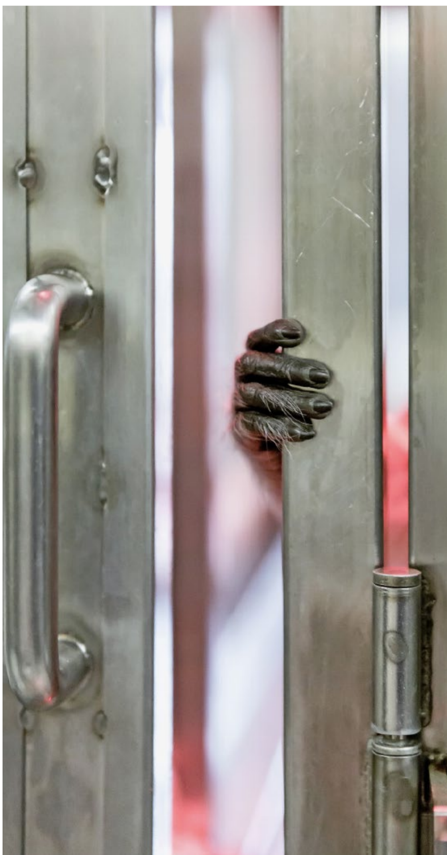
Javaneräffin Jo im Gehege am Irchel: Sie kehrte nach Freiburg zurück.

Es sei ein grosser Rückschritt, da seit 2008 die Würde des Tiers im revidierten